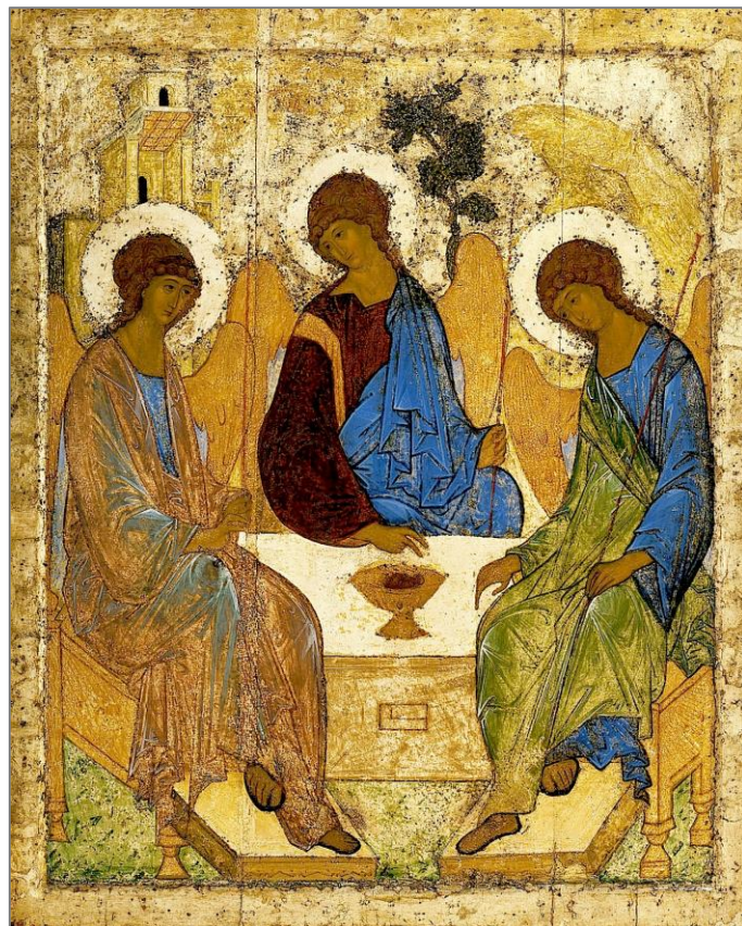
Andrei Rublev, Heilige Dreifaltigkeit (Ikone), um 1425. Tretyakov Gallerie, Moskau.