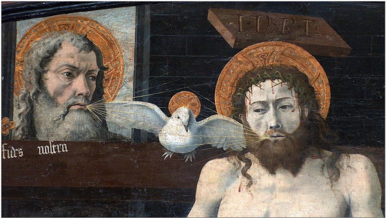
Retabelgemälde in der Kapelle Saint-Marcellin, Boulbon, Provence, ca. 1450. Louvre, Paris.